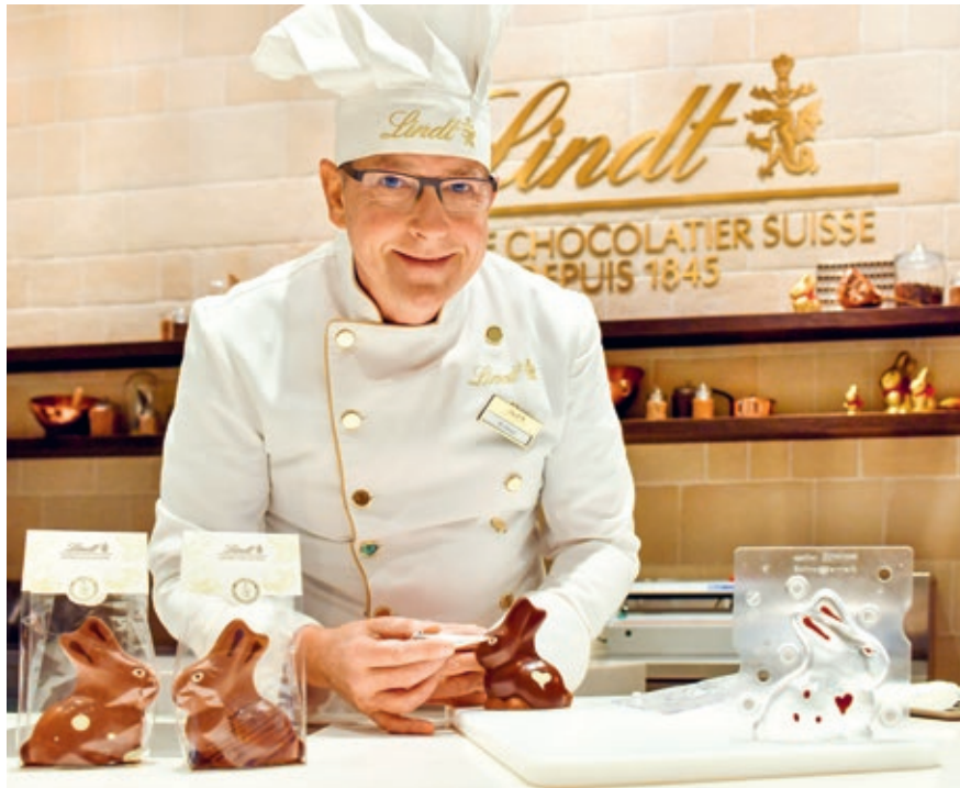
Schokoladenfans können den Lindt Maîtres Chocolatiers bei der Herstellung feiner Kreationen über die Schulter sehen.